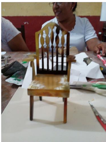
Capacitación de cuerno taller. Yaxunah, Yucatán.