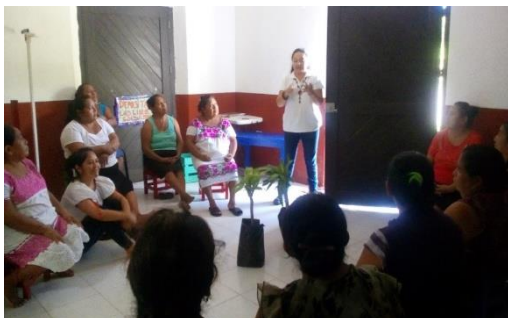
Pláticas de autocuidado a artesanas de urdido de hamacas en Yaxunah, Yaxcabá.