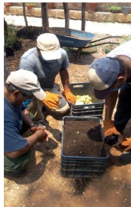
Taller de lombricomposta.