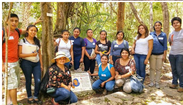
Jóvenes de Temozón y Yaxunah en su visita al CICY.