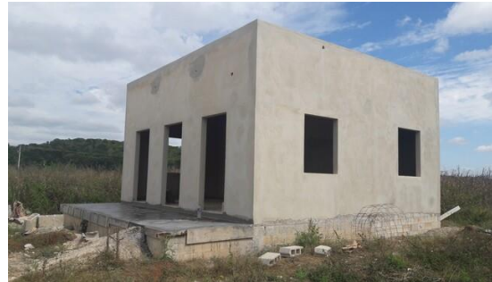
Avance de obra de taller de telar en Quetzal, Campeche.