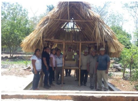
Taller de Meliponicultura básica.