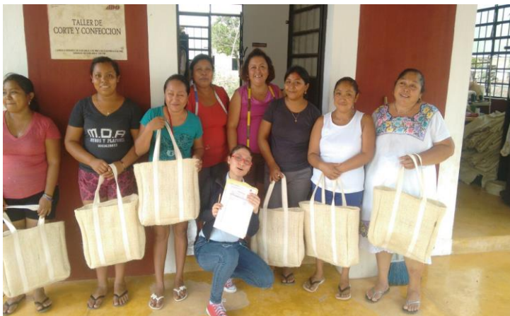
Taller de costura, Santo Domingo.