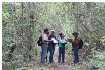
Monitoreo de aves. Castellot II