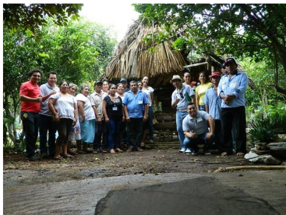
1er Encuentro Red de Meliponicultores Traspatio Maya. Noviembre; Chablekal, Mérida.