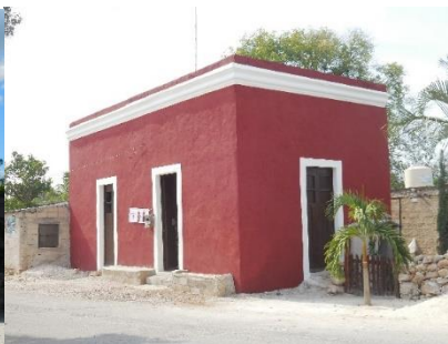
Vivienda de tipo hacienda con fachada rehabilitada antes y después en San Antonio Chun, Umán.