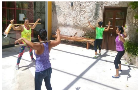
Grupos de zumba en Castellot II y San Antonio Chum.