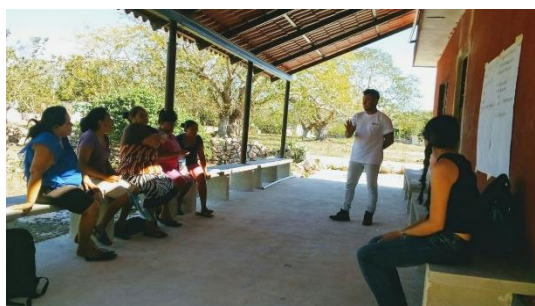
Sesión de trabajo en Chunchucmil para definir compromisos y alcances de la rehabilitación de la Casa de salud.