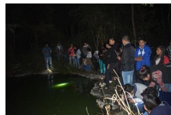
Segundo encuentro de capacitación a instructores voluntarios de Sal a pajarear.