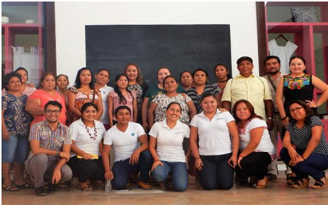
Auxiliares de salud en capacitación de desarrollo humano y planeación 2017.