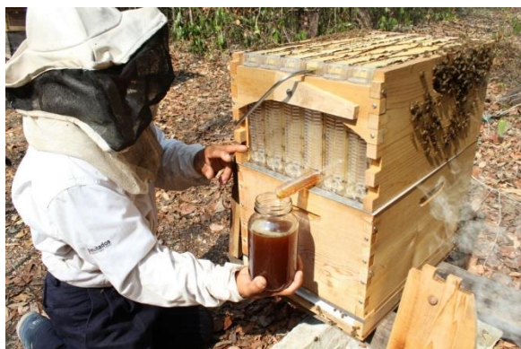
Cosecha de miel. Colmena FlowHive. Veinte de Noviembre, Calakmul