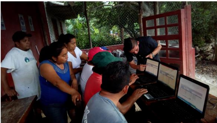
Taller de Cuerno y Urdido, Yaxunah.