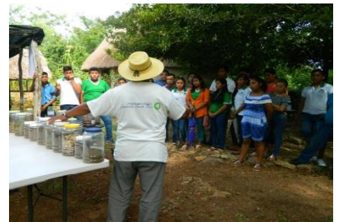
Evento en el jardín botánico con escuelas.