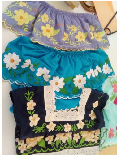
Capacitación de bordado a Maquina. X-Kanchakán, Yucatán.