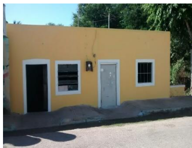
Viviendas con fachadas tipo hacienda rehabilitadas en Temozón e Itzincab.