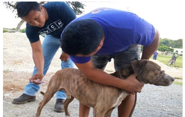
Campañas de zoonosis en comunidades en 2017.