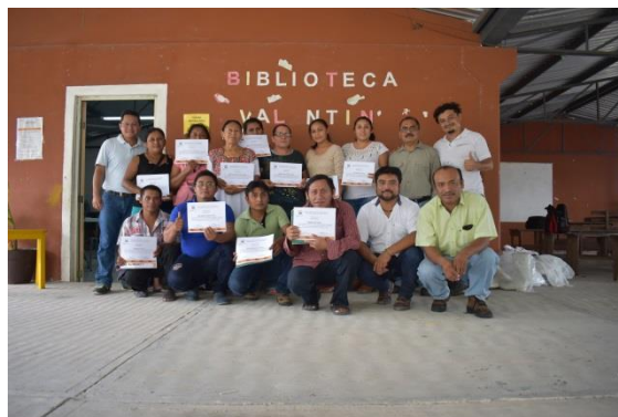
Capacitación Procesos para la certificación en Producción Orgánica de Miel. Valentín Gómez Farías, Calakmul.