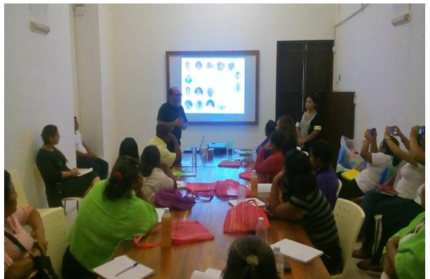
Presentación del CICY a red de auxiliares de salud.