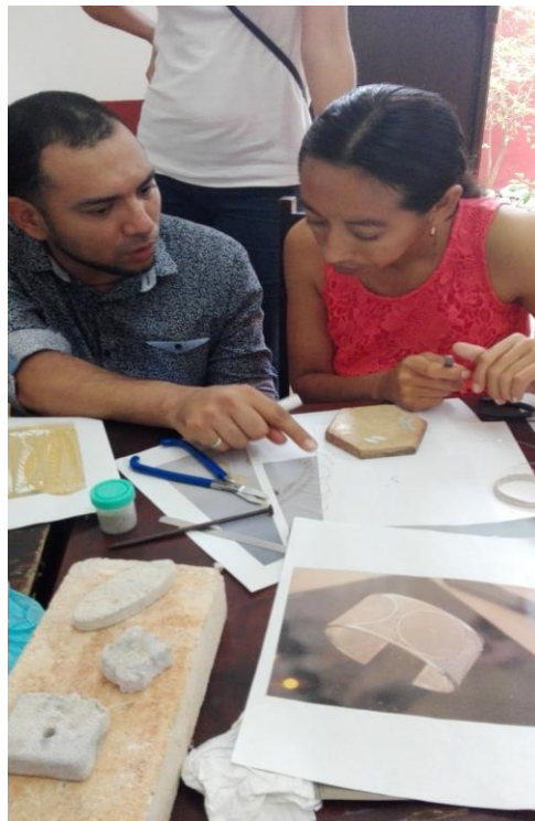
Capacitación a talleres de filigrana de plata. Ochil, San Antonio Millet y Santa Rosa.