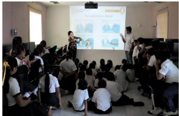
Campañas de higiene personal en comunidades en 2017.