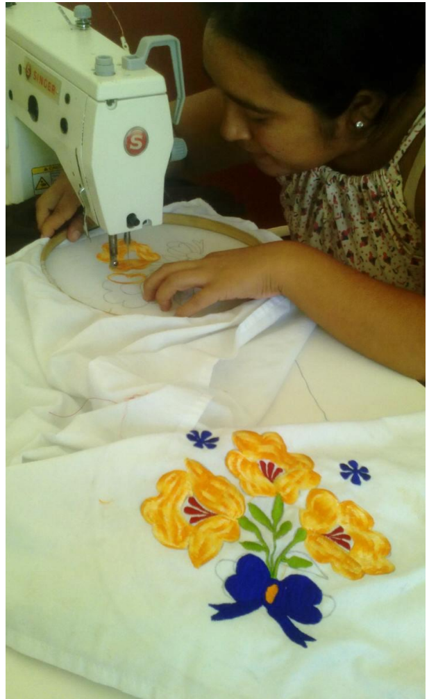
Taller de bordado a maquina, X-Kanchakán.