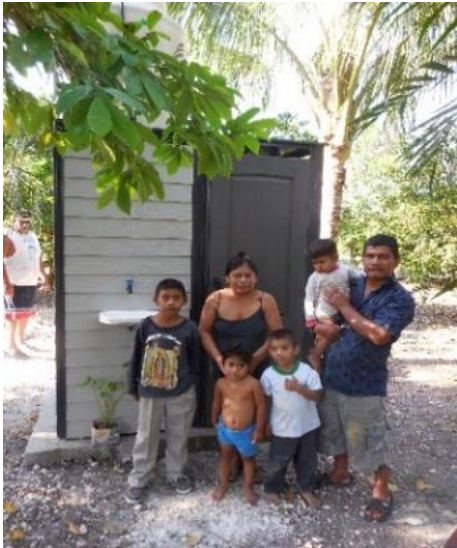
Familia de siete integrantes de Nuevo Conhuás en Calakmul que aceptaron pilotear el modelo de baño prefabricado donado por Rotoplas.