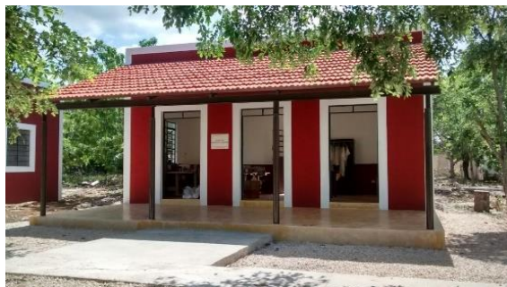
Taller de bordado a máquina en Santo Domingo, Maxcanú.