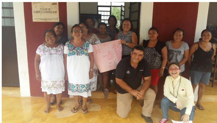
Capacitación Mi empresa, mi negocio. Santo Domingo. Maxcanú.