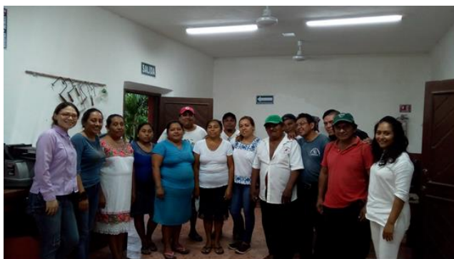
Capacitación de Costos Yaxunah, Yaxcabá.