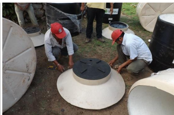
Armado de biodigestores en Yaxunah, Yaxcabá.