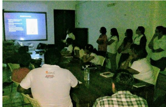
Pláticas informativas al equipo de FHMM sobre la rabia y el mal de Chagas.