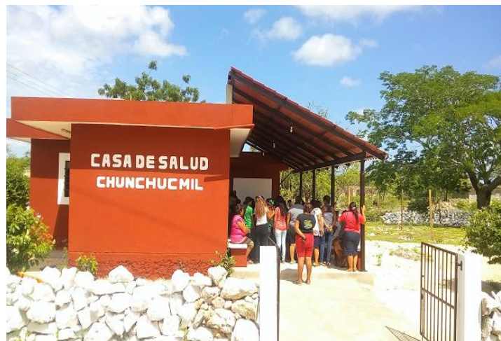
Reapertura de la Casa de salud en Chunchucmil, Maxcanú.