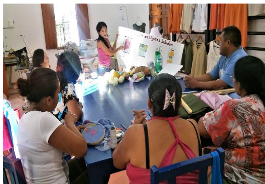
Diagnóstico nutricional a artesanas como parte del proyecto de becaria de nutrición de FHMM.