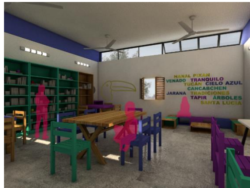
Avance de obra y perspectiva interior de la biblioteca de Cancabchén, Hopelchén.