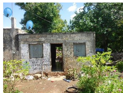
Vivienda de tipo hacienda rehabilitadas antes y después en Granada, Maxcanú.