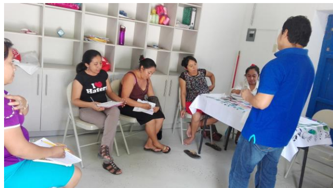
Capacitación de Mi perfil mi Empresa, Talleres de Ukum e Xmabén, Campeche.