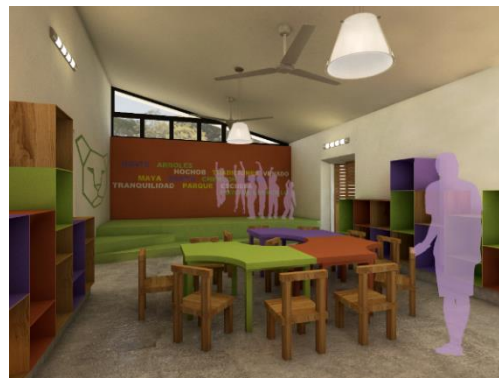
Avance de obra y perspectiva interior de la biblioteca de Chencoh, Hopelchén.