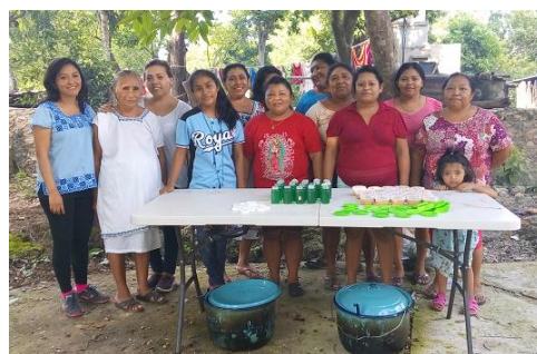
Taller de medicina tradicional a artesanas en X-kanchakán, Tecoh.