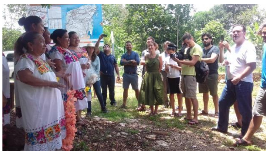
Hokol vuh 2017, Yaxunah

Se forma parte de la esta comunidad de aprendizaje en la zona de Campeche sur, impulsada por ECOSUR Chiapas y la Red de Agroecología de California. Se está conformando una paquete de insumos y herramientas para el trabajo comunitario y ejecución de proyectos de agroecología y seguridad alimentaria.