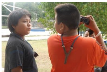
Salida a pajarear. San Antonio Chum, Umán.